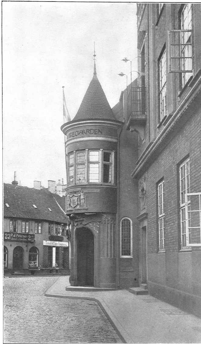
FIRMAETS KONTORBYGNING „KANNIKEGAARDEN“ VED SIDEN AF POSTHUSET. AARHUS.